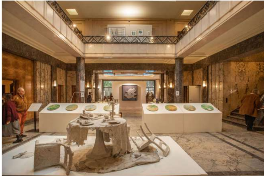
À l'entrée, la superbe installation créée par « The Great Design Disaster », signée Gregory Galtserelia devant les céramiques de la série « Olivéa » d'Etel Adnan.

OLJ / Carla HENOUD, à Bruxelles, le 14 février 2023 à 00h01