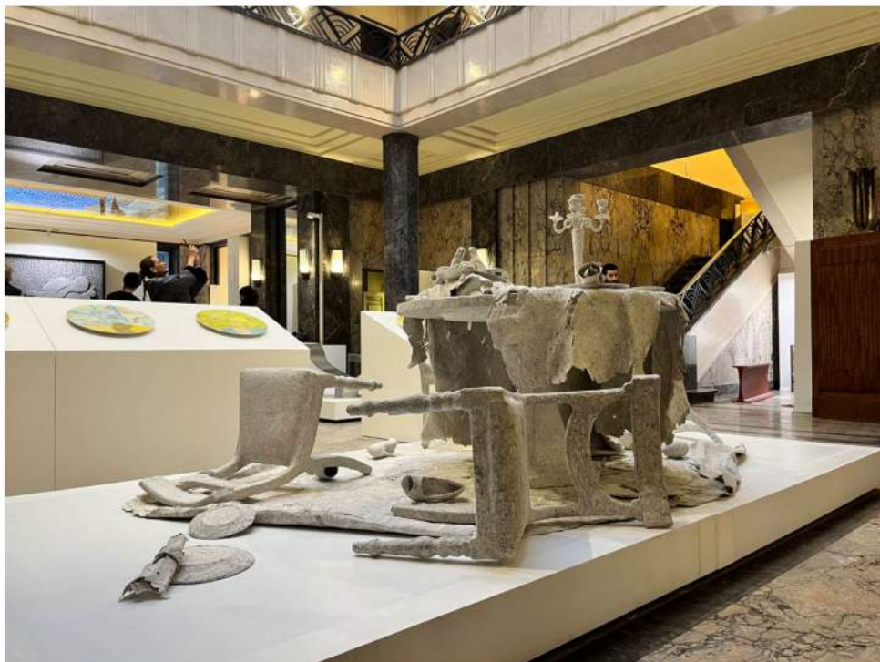
Post-Disaster Room presents a scene frozen in time, inspired by the 2020 Beirut blast.

Gatseleria first moved to Beirut in 1996, seeking a more dynamic design and architecture scene following several years of working in Toronto. With Lebanon reopening to the world and slowly rebuilding its urban landscape after the civil war, which raged from 1975 to 1990, it seemed like the perfect opportunity to explore the region. Despite numerous upheavals since, Gatseleria has never left.