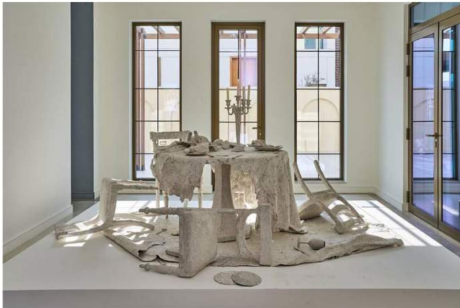
Post-Disaster Room consists of furniture sourced from a Beirut flea market, coated in recycled paper.

► Recently displayed in Brussels, the installation is part of a wider effort to support Lebanese artisans