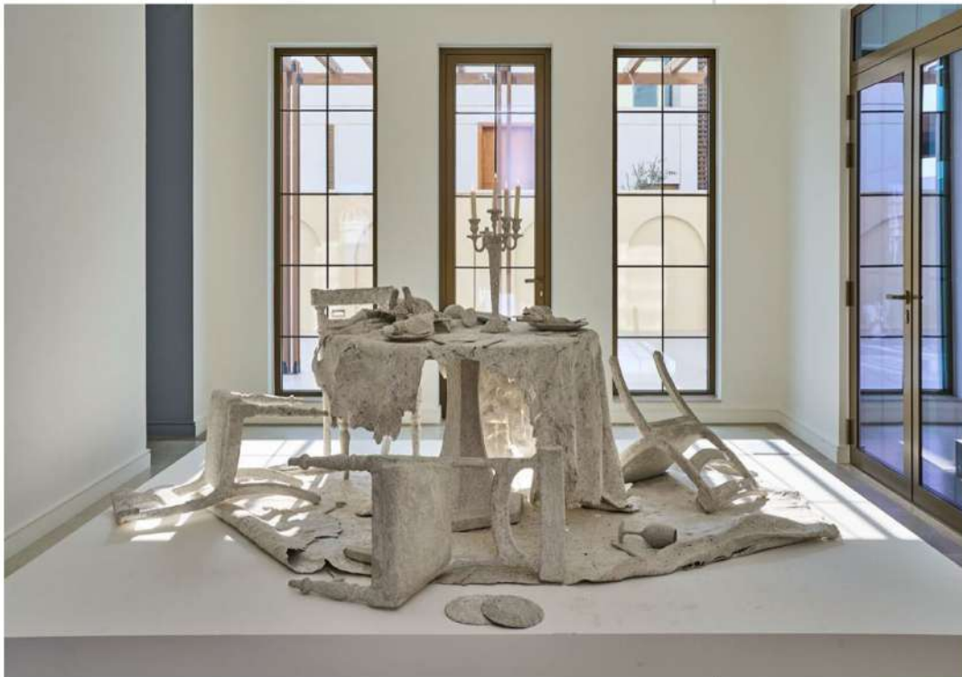
Gregory Gatsereia, Post-Disaster Room, 2022, existing furniture sourced from the Flea Market in Beirut (Basta), covered in recycled paper by a Lebanese artisan, 350x280cm