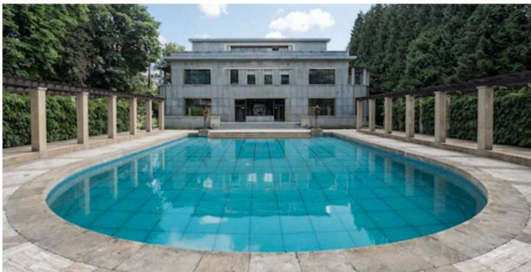
La Fondation Boghossian_Villa Empain