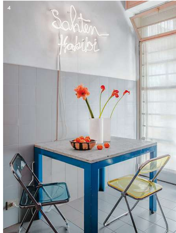
1/ Façade de l'immeuble de Joy Herro. Un style architectural brutaliste et rationaliste, inspiré du groupe BBPR pour les étages et d'Asnago et Vender pour le rez-de-chaussée. 2/ Dans la chambre, paravent vintage. Chaise en bronze de Karim Chaya (2015). Miroir Lipstick , design Roger Lecal (1970, Chabrières & Co). 3/ Sculpture Candor Chasma Rim de Raquel Quevedo. Coupe à fruits Murmansk , signée Ettore Sottsass (Memphis Milano). 4/ Table vintage. Chaises Plia de Giancarlo Piretti (1970, Castelli). Néon Sahten Habibi , design Gregory Gatslerelia. Page de droite Dans la chambre, au mur, œuvres Obelisk et Blackboard de Franco Angeli (1988). Meuble Bliard Créations (2005). Lampadaire chiné aux puces.