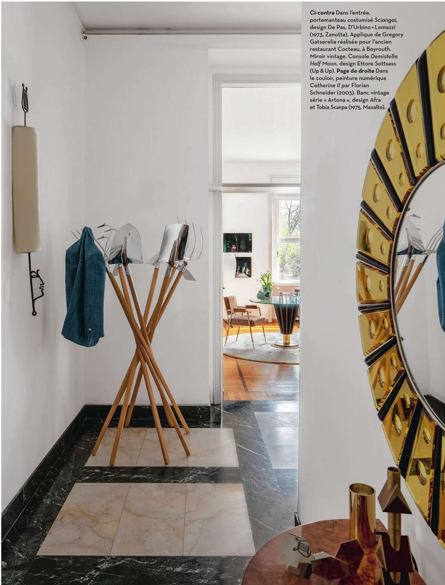
Ci-contre Dans l'entrée, portemanteau costumisé Sciangai, design De Pas, D'Urbino + Lomazzi (1973, Zanotta). Applique de Gregory Gatsleria réalisée pour l'ancien restaurant Cocteau, à Beyrouth. Miroir vintage. Console Demistella Half Moon , design Ettore Sottsass (Up & Up). Page de droite Dans le couloir, peinture numérique Catherine II par Florian Schneider (2003). Banc vintage série « Artona », design Afra et Tobia Scarpa (1975, Maxalto).